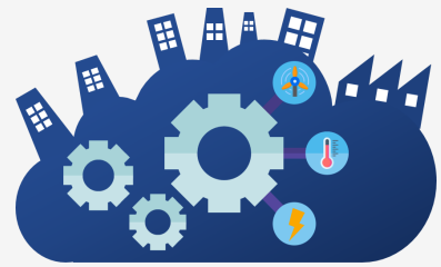
資料中心綠色運算

大會經過初步的篩選後，將考量競賽會場條件，並參酌團隊的意向來分配其中一項主軸，題目說明與分配結果將於 12/17 TSMC Workshop 中揭曉。